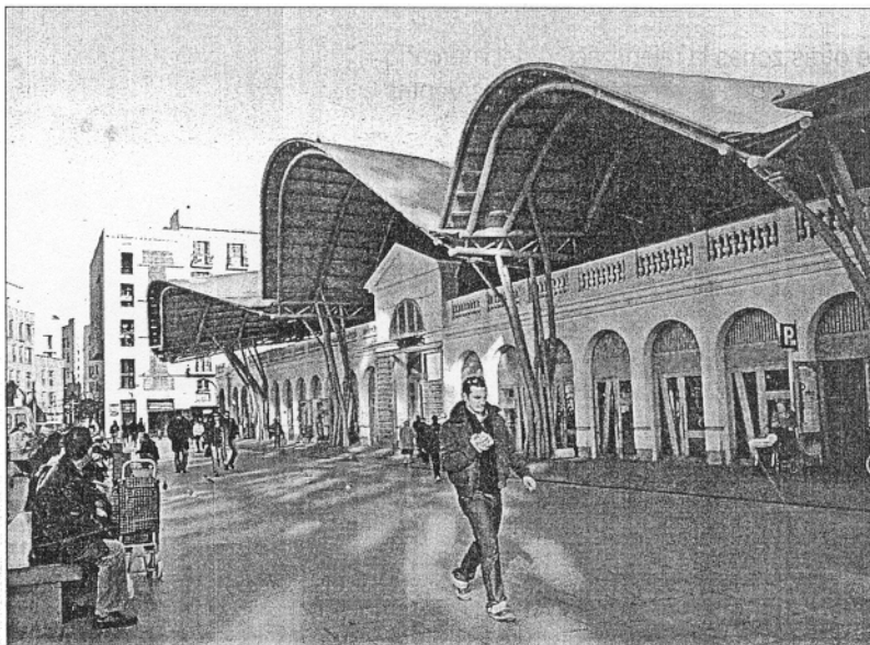
El mercado de Santa Caterina, en Barcelona, ha sido el catalizador del barrio.

La cohesión es una preocupación en Francia desde 1973, cuando se dictó una orden ministerial para evitar la segregación en las ciudades. Desde entonces, se aprobaron varias normas que culminaron en la Ley de Renovación Urbana